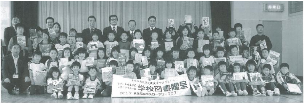
贈呈された図書を持ち笑顔の児童と東京昭島中央ロータリークラブの皆さん

～岩手県岩泉町立小本小中学校への津波による流出図書支援プロジェクト～ 2012年6月22日（金）現地での図書寄贈の様子が岩泉町の広報に掲載されました。