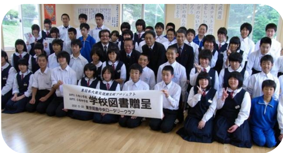
小本中学校の児童達