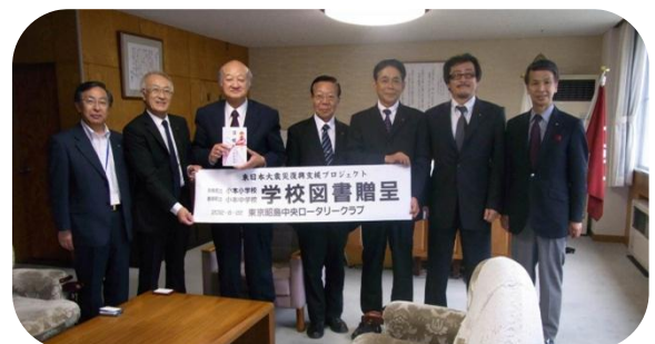
岩泉町長へ目録贈呈