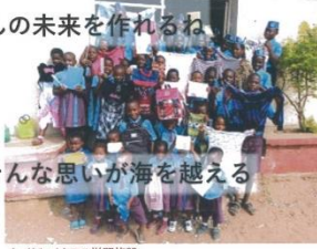
ナイジェリアの学習施設