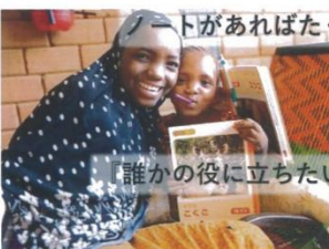
ニジェールの医療関連施設