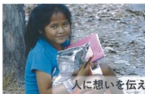
フィリピンアタラ