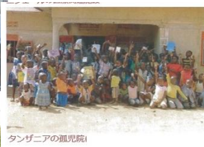
タンザニアの孤児院